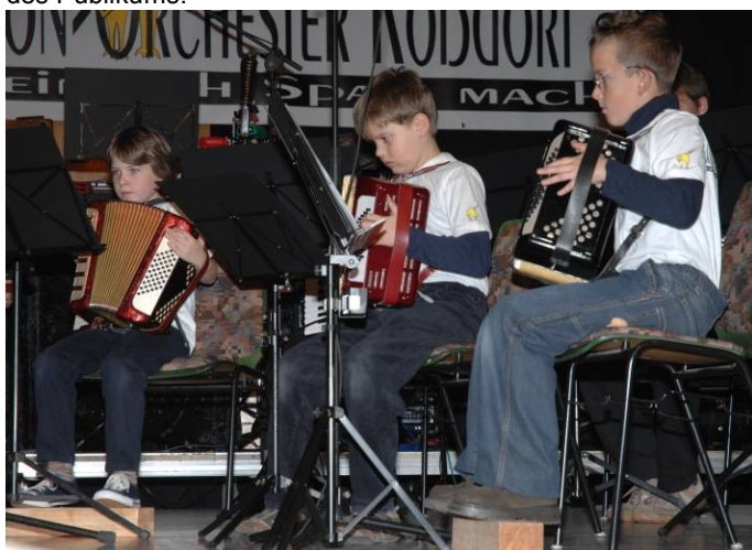
Die allererste Konzerterfahrung